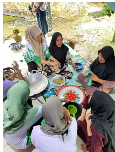
Gambar 5 Kegiatan Pendampingan pembuatan produk wedang