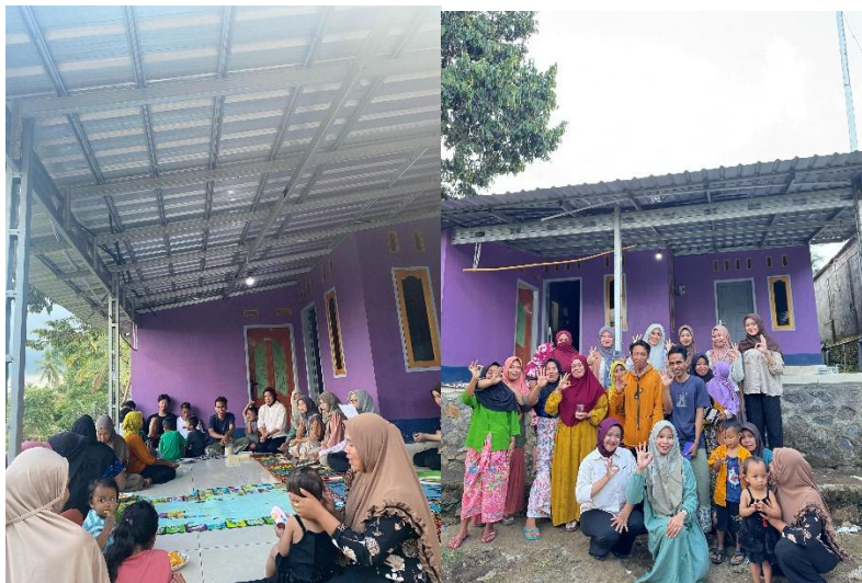
Gambar 4 Sosialisasi dan pembagian kelompok UMKM di Dusun Tumpang Sari Desa MekarSari)

Sebagai bagian dari inisiatif untuk memberdayakan ekonomi masyarakat, peserta kemudian dibagi menjadi beberapa kelompok Usaha Mikro, Kecil, dan Menengah (UMKM) berdasarkan minat dan lokasi tempat tinggal mereka. Tujuan dari pembagian kelompok ini adalah untuk mendukung produksi dan pengembangan usaha minuman herbal secara berkelanjutan, sekaligus mendorong kerja sama dan sinergi di antara anggota kelompok dalam aspek produksi, pemasaran, dan inovasi produk.