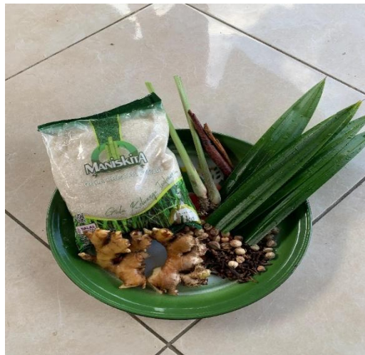
Gambar 2 Bahan yang digunakan dalam pembuatan wedang