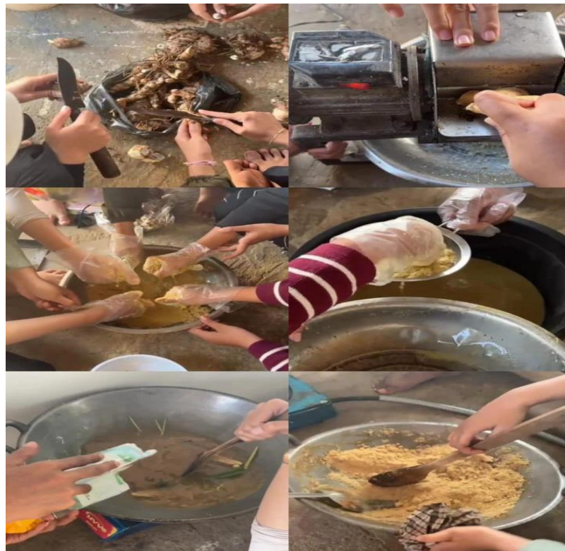
Gambar 3 Langkah-langkah Pembuatan wedang Jahe, Temulawak dan Temu Ireng

temulawak 1Kg, temu ireng 1Kg, Gula Tebu 1Kg, cengkeh sesuai selera, 4biji kapulaga, 2 kulit kayu manis, 2 helai daun pandan, 2 batang sereh, air (di sesuaikan dengan banyaknya produk yg di buat). Tahap-Tahapan yang dilakukan dalam pembuatan Wedang adalah. A). siapkan jahe, temulawak dan temu ireng yang berkualitas kemudian di cuci sampai bersih: B). selanjutnya parut jahe sampai halus menggunakan mesin parut: C). kemudian peras jahe untuk diambil airnya: D). lalu saring jahe supaya serat nya hilang: E). peras kembali untuk memastikan air perasan jahe sudah habis: F). tambahkan air secukupnya dan saring lagi diamkan selama kurang lebih 10 menit: G). selanjutnya saring semua bekas perasan jahe,temulawak dan temu ireng ke dalam wajan yang sudah disiapkan: H). setelah itu nyalakan api besar dan aduk perasan jahe, temulawak dan temu ireng: I). setelah panas, tambahkan 2 lembar daun sereh, 4 biji kapulaga, 2 kulit kayu manis, 2 helai daun pandan dan aduk terus: J). setelah itu tunggu sampai panas, lalu masukkan gula, disini karna kita menggunakan 1Kg jahe ,temulawak dan temu ireng maka gulanya juga kita tambahkan 1Kg biar sebanding: K). lalu selanjutnya aduk sampai teksturnya menjadi padat: L). setelah menjadi bubuk, angkat lalu segera di sangrai supaya tidak menggumpal, dan sangrai hingga terpisah: M). setelah itu, pindahkan bubuk ke dalam wadah, lalu ambil yang menggumpal, lalu wedang sudah siap untuk disajikan.