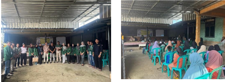
Gambar 6 Kegiatan Workshoop untuk masyarakat Dusun Tumpang Sari