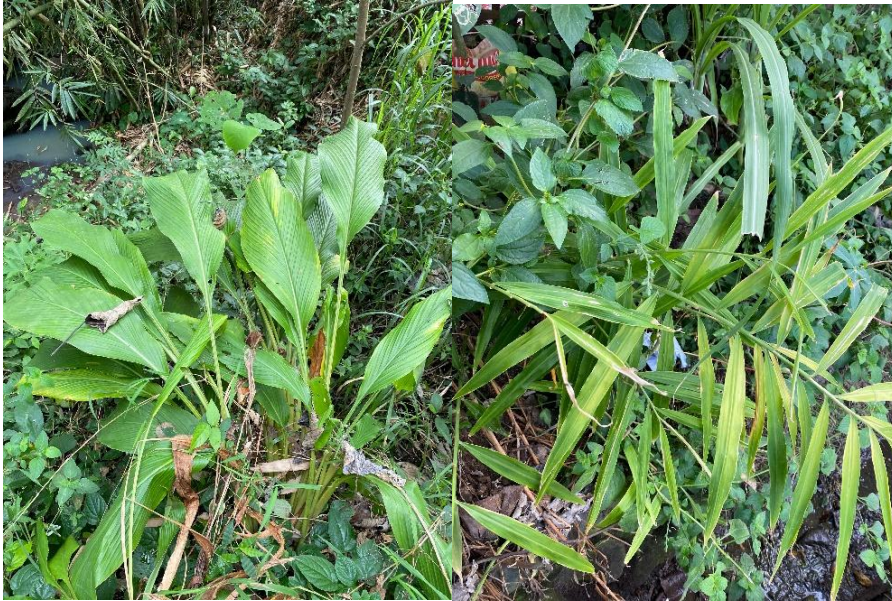
Gambar 1. Tanaman Jahe, Temulawak dan Temuireng di Dusun Tumpang Sari

Langkah berikutnya ialah melakukan pengkajian teori tentang rimpang (empon-empon) yang dapat diolah menjadi sebuah produk. Hasil dari kajian yang diperoleh ada Jahe, Temulawak, Temu Ireng, Sereh, Cengkeh dan Kunyit dapat dimanfaatkan untuk pembuatan minuman herbal. Manfaat rempah-rempah tersebut adalah sebagai berikut: