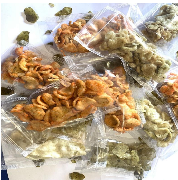
Gambar 1: Produk olahan daun kelor

Berbagai inovasi dalam pengelolaan daun kelor menjadi produk yang memiliki nilai tambah, seperti kerupak daun kelor, stik daun kelor dll. Ini bisa menjadi peluang ekonomi bagi perempuan di Dusun Tejong. Meski begitu, apa yang dilakukan tidak bisa berjalan dengan apa yang diharapkan. Dalam pelaksanaannya tidak semua berjalan dengan apa yang diharapkan, terutama dalam pengelolaannya. Begitu besar potensi yang dimiliki namun belum dimanfaatkan secara keseluruhan. Namun dengan adanya KKN Bina Desa dalam melakukan pengabdian tumbuh kesadaran masyarakat khususnya perempuan untuk memanfaatkan daun kelor sebagai nilai tambah dalam meningkatkan perekonomian keluarga.