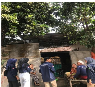
Gambar 1.1 Observasi