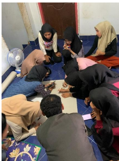
Gambar 1: Menggambar Sketsa Dusun Tejong

Selain potensi muncul beberapa persoalan di masyarakat seperti kekurangan air bersih, TKW, kurangnya lapangan pekerjaan dll. Dari persoalan tersebut mahasiswa KKN bersama masyarakat menyusun strategi untuk menjawab semua persoalan tersebut. Namun melihat kondisi masyarakat dan mahasiswa KKN memilih untuk menyelesaikan satu persoalan yang bisa dikembangkan oleh masyarakat khususnya perempuan dan bisa menambah nilai ekonomi perempuan di dusun Tejong yaitu pengelolaan potensi daun kelor menjadi makanan olahan kerupuk kelor.