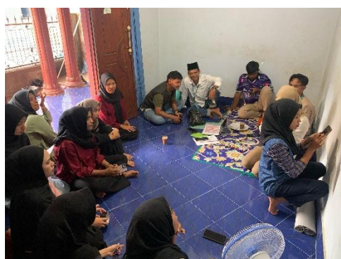
Gambar 1.2 Diskusi Potensi Dusun