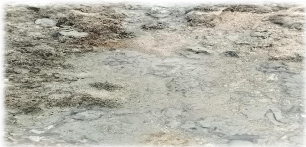
Sumber foto: Mata Air Opualia (Air Di Khususkan Untuk Orang-Orang Raja)