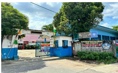
Gambar 1 SD Negeri 110 Palembang

Penelitian ini dilaksanakan di SD Negeri 110 Palembang, yang terletak di Jl. Lakitan Raya Sako, Kecamatan Sako, Kota Palembang, Provinsi Sumatera Selatan dengan kode pos 30163. Penelitian ini bertujuan untuk mengetahui adakah pengaruh model pembelajaran self-directed learning (SDL) terhadap keterampilan menulis teks narasi pada siswa kelas IV SD Negeri 110 Palembang. Penelitian dilakukan pada kelas IV A dan IV C berlangsung selama kurang lebih dua minggu sebanyak empat kali pertemuan di kelas kontrol maupun kelas eksperimen.