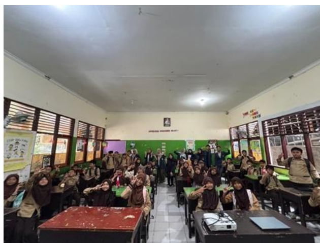
Gambar 2. Dokumentasi bersama siswa-siswi

diterapkan berjalan secara efektif, tepat sasaran, dan mampu meningkatkan kesadaran siswasiswi, sehingga layak untuk dikembangkan dan diterapkan secara berkelanjutan pada kegiatan serupa di masa mendatang. Hal ini sekaligus menegaskan bahwa kegiatan pengabdian yang dilakukan telah sejalan dengan tujuan yang ingin dicapai, khususnya dalam upaya meminimalkan dampak negatif penggunaan smartphone di lingkungan sekolah serta mendukung tumbuh kembang siswa-siswi secara optimal.